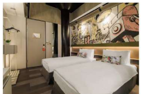
ツアー①：2020年2月22日(土) ツアー②：2020年2月29日(土)

かつての第一銀行の金庫をリノベーションした、アートとファッションを取り入れたデザイナーズホテルです。