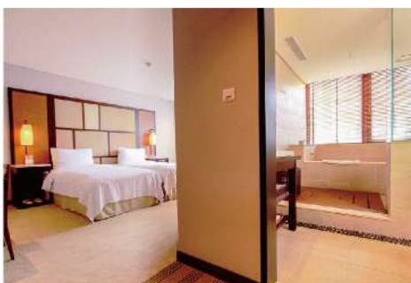
ツアー①：2020年2月21日(金) ツアー②：2020年2月28日(金)